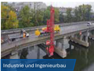
Industrie und Ingenieurbau