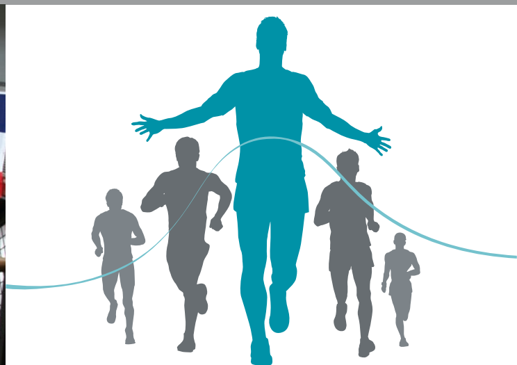
Sportmanagement am RheinAhrCampus!